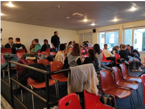
Ateliers d'écriture collective